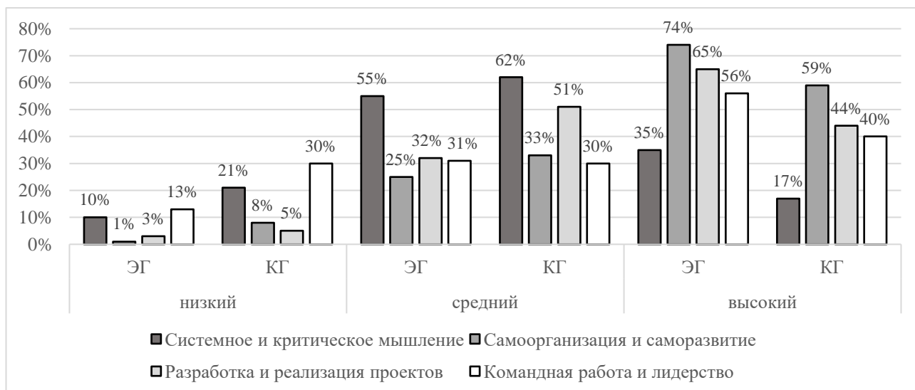
Рисунок 3 – Результаты итоговой диагностики уровня сформированности универсальных компетенций у студентов 4-го курса

На завершающем этапе эксперимента (апрель–май 2024 г.) была проведена итоговая диагностика навыков и уровня сформированности универсальных компетенций студентов 4-го курса (8-й семестр) экспериментальной и контрольной групп. Результаты в графическом виде представлены на рисунке 3.